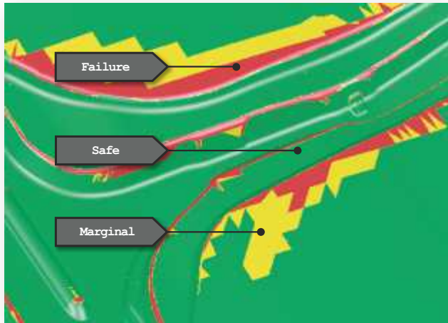
硬質クロム・メッキによる金型の不具合(赤色部分)

金型のエンジニアリング段階で効率的な摩耗防止コンセプトを定義できれば、後のトライアウトや生産段階にて高いコストを伴う金型の修正を回避できます。このように効率的なコンセプトによって、金型の性能、使い勝手、耐久性を強化することができ、さらにはコストの削減まで達成できます。