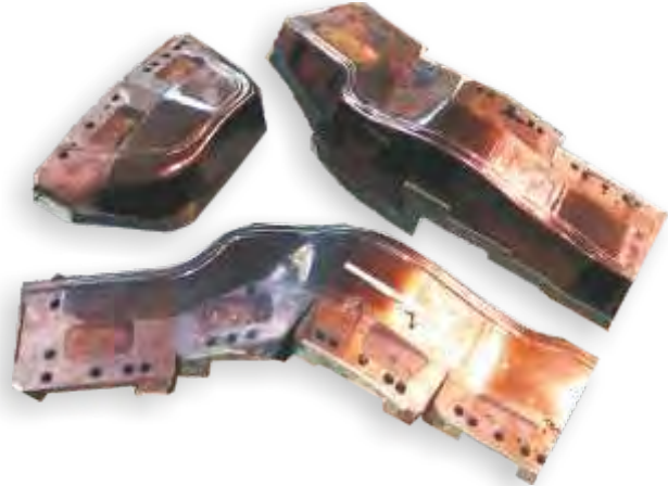
高度PVDコーティングされた鋼材セグメント

生産における不良品およびプレスのダウンタイムの抑制、潤滑量の削減、そしてプレスのストローク数の増加によって、生産効率を向上できます。さらには部品品質の向上および安定性も期待できます。